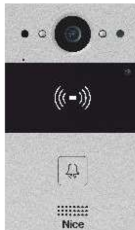
BLUE KEY PLUS